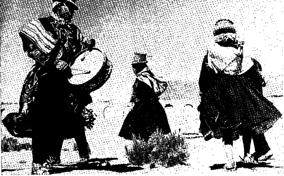
7. Bailarines aymaras en una festividad en el Altiplano, cerca de la ciudad de La Paz.