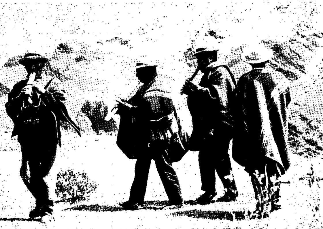
8. "Callawayas" (o médicos indígenas) de Charazani, antes de salir para uno de sus periódicos viajes. Obsérvese la bolsa en la que llevan sus yerbas y medicamentos.